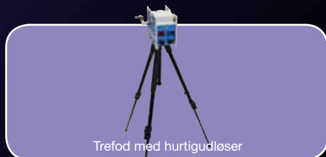
Trefod med hurtigudløser