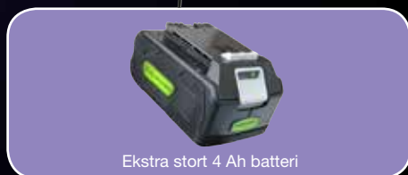
Ekstra stort 4 Ah batteri