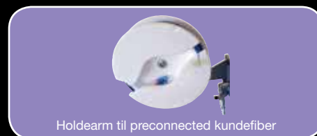
Holdearm til preconnected kundefiber