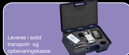
Leveres i solid transport- og opbevaringskasse