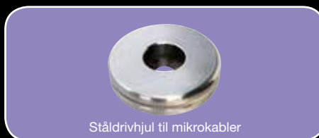
Ståldrivhjul til mikrokabler